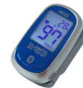
パルスオキシメーター (BO-750BT)