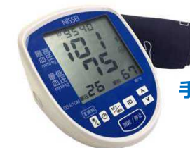
上腕式デジタル血圧計 (DS-S10-M)