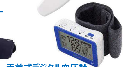
手首式デジタル血圧計 (WS-M50BT)